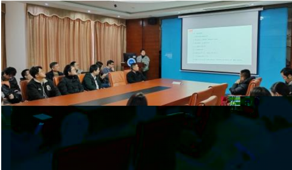
图 员工专业技 培