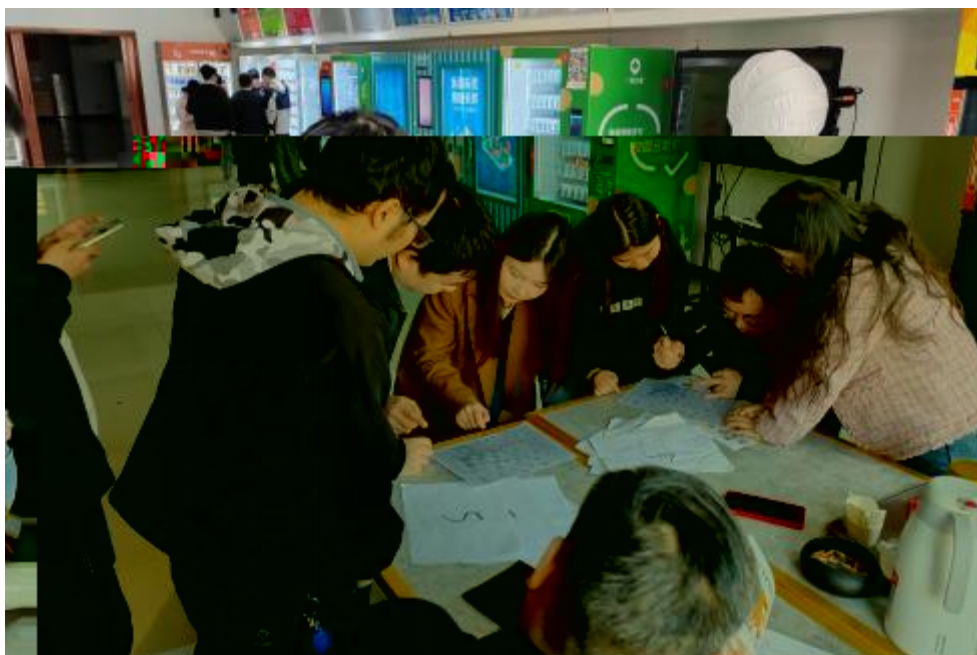
图 卓 团 建 共