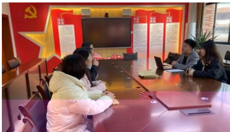
图 企开展学术 交 会