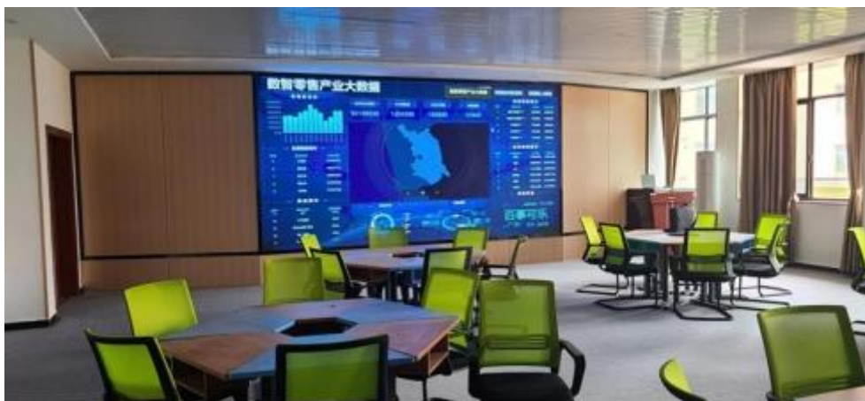
图 智慧 售 中心