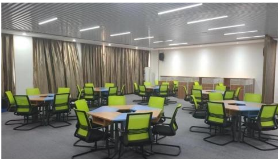
图 智慧 售 中心